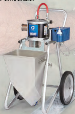
BOMBA DE PISTÓN

La bomba a pistón ToughTek M680a maneja materiales abrasivos tales como morteros epoxi, recubrimientos antideslizantes (puentes y sector marítimo, recubrimientos a base de solventes) o materiales cementosos, y es ideal para polímeros difíciles con rellenos tales como escamas de vidrio, sílice o arena. El diseño completamente inoxidable hace que la limpieza de morteros epoxi sea fácil y no genere ninguna dificultad.