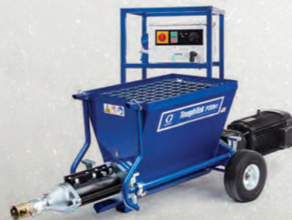
BOMBA DE ESTATOR/ROTOR

Si le gusta el tamaño compacto de la bomba de estator/rotor P20, pero está buscando más producción, la ToughTek P30HT es la opción perfecta para su empresa. Actualícese a esta bomba si planea usar morteros epóxicos (u otros materiales espesos de alta viscosidad) o planea pulverizar edificios más altos, como estadios deportivos, rascacielos, complejos de departamentos, hospitales o estacionamientos, por nombrar algunos ejemplos.