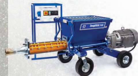
BOMBA DE ESTATOR/ROTOR

La bomba ToughTek P40, conocida como la bomba indispensable debido a su presión de salida de 600 psi, está fabricada para aplicaciones de alto volumen. El caudal elevado y la alta presión permiten a los contratistas bombear mortero de reparación sobre un edificio alto mientras mantiene la bomba a nivel del suelo, lo que le ahorra tiempo de operación.