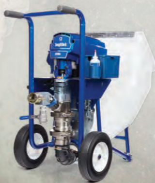
BOMBA DE PISTÓN

La bomba ToughTek S340e, diseñada con la tecnología patentada de bomba de pistón de Graco, puede manejar fácilmente morteros de reparación con áridos de tamaño pequeño a mediano. La bomba S340e también puede suministrar todos los materiales a través de mangueras de gran longitud, lo que le permite pulverizar desde mayores distancias y realizar el trabajo de manera más rápida.